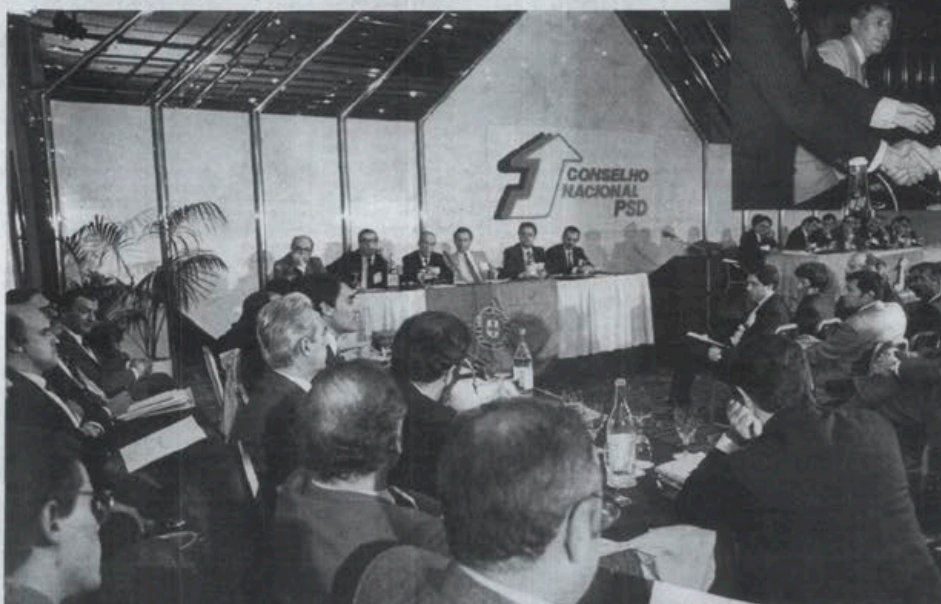
Cavaco Silva usando da palavra no início dos trabalhos do Conselho Nacional do PSD. Em cima, à direita, cumprimentando o Presidente da Mesa, Montalvão Machado (mais noticiário nas páginas 2 e 3)

— O aumento da eficiência da administração.